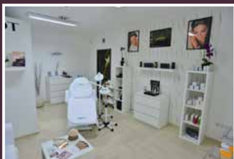
Salon Lashes - Komárno

Vítáme do rodiny kosmetických salónů PAYOT: